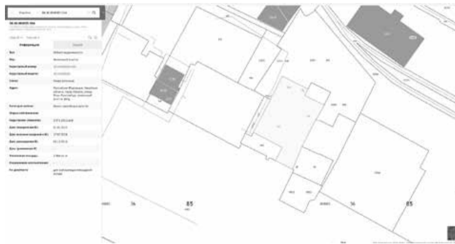
СХЕМА РАСПОЛОЖЕНИЯ ЗЕМЕЛЬНОГО УЧАСТКА, В ОТНОШЕНИИ КОТОРОГО ПОДГОТОВЛЕН ПРОЕКТ РЕШЕНИЯ О ПРЕДОСТАВЛЕНИИ РАЗРЕШЕНИЯ НА УСЛОВНО РАЗРЕШЕННЫЙ ВИД ИСПОЛЬЗОВАНИЯ «ЗДРАВООХРАНЕНИЕ» В ОТНОШЕНИИ ЗЕМЕЛЬНОГО УЧАСТКА С КАДАСТРОВЫМ НОМЕРОМ 38:36:000005:564, ПЛОЩАДЬЮ 2390 КВ. М, РАСПОЛОЖЕННОГО ПО АДРЕСУ: РОССИЙСКАЯ ФЕДЕРАЦИЯ, ИРКУТСКАЯ ОБЛАСТЬ, ГОРОД ИРКУТСК, УЛИЦА РОЗЫ ЛЮКСЕМБУРГ, ЗЕМЕЛЬНЫЙ УЧАСТОК 182Д.

Учитывая запрос Общества с ограниченной ответственностью «Лаборатория имени Святителя Луки» о предоставлении разрешения на условно разрешенный вид использования земельного участка, предоставить разрешение на условно разрешенный вид использования «Здравоохранение» в отношении земельного участка с кадастровым номером 38:36:000005:564, площадью 2390 кв. м, расположенного по адресу: Российская Федерация, Иркутская область, город Иркутск, улица Розы Люксембург, земельный участок 182д.